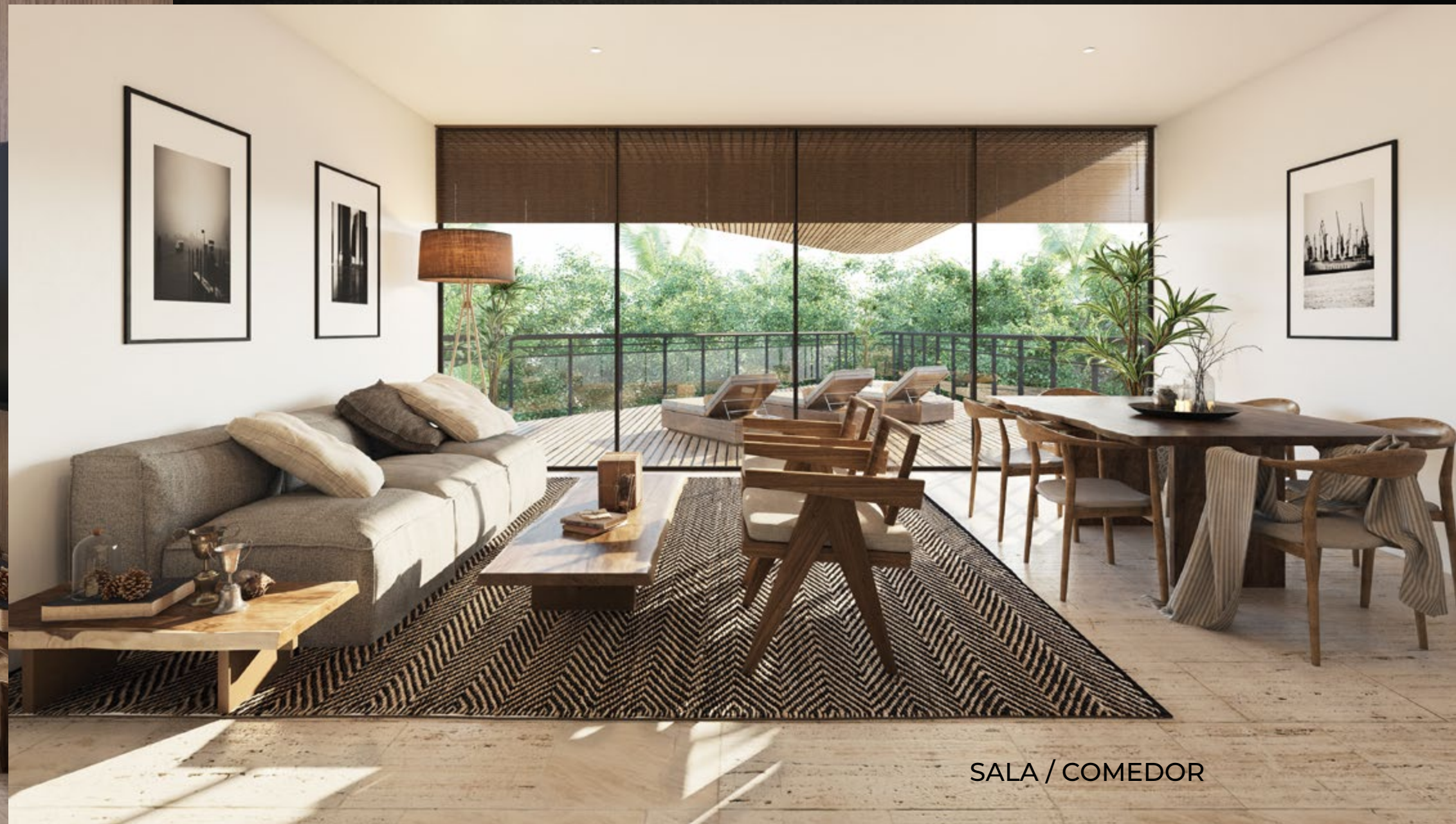
SALA / COMEDOR